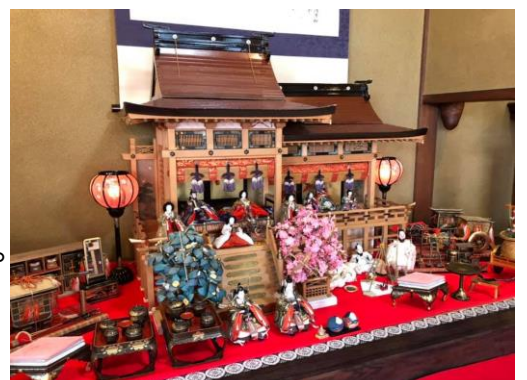
イベント展示の様子

また情報発信にも取り組み、認知度を高めて集客力のあるイベントに育て、収入に繋げることで、自立的運営を目指します。