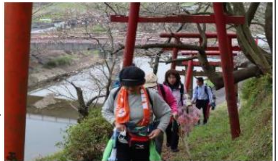
フットパス当日の様子

フットパスを通じた交流人口の増加や経済の活性化、地域資源の保全を目指し、新しいコースの選定や、マップの作成、モニターツアーの開催などに取り組みました。今後は、参加費収入等による自立的運営を目指します。